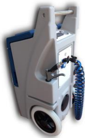
Machine de nettoyage